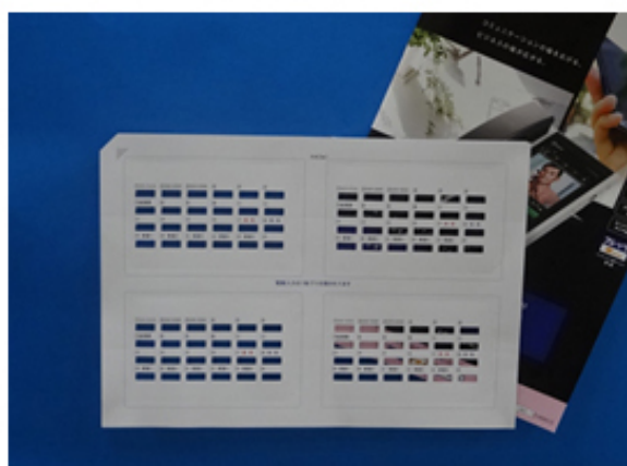
透明(クリア)タイプ